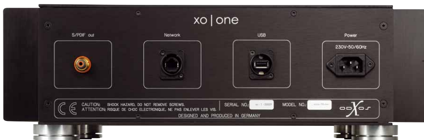
Hinten gibt es nur das Nötigste: Stromzufuhr, USB, Netzwerkanschluss und ein S/PDIF-Ausgang