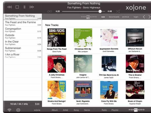
Mit dem Tablet hat man direkten Zugriff auf das Angebot von HighResAudio.com. Gekaufte Titel werden direkt heruntergeladen