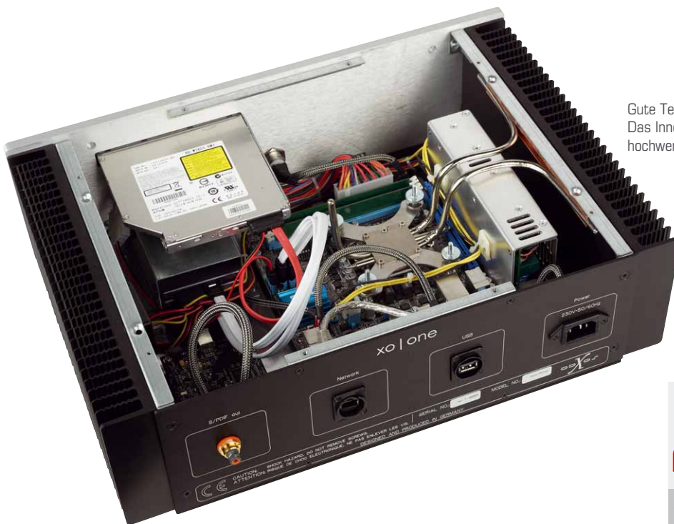
Gute Technik braucht ihren Platz: Das Innere des Servers bietet hochwertige Hardware