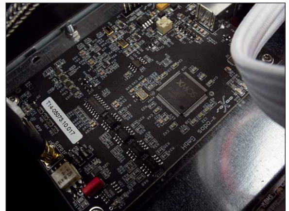
Mit dem XMOS-Chip ist einer der derzeit besten Multicontroller verbaut

M it ihrem Erstlingswerk xo|one setzt die junge Freiburger Firma X-odos gleich ein Statement auf dem digitalen HiFi-Markt. Der xo|one ist nichts weniger als ein hervorragend verarbeiteter, vollformatiger Musikserver, der durch seine hochwertigen Hardwarekomponenten glänzt. Das Gerät ist in edelschlichter Optik gehalten und archiviert dank CD-Laufwerk nebst integrierter Festplatte problemlos die Musiksammlung. Alternativ können Musikdateien bis 192 kHz/24 Bit per Netzwerk auf den xo|one transferiert werden. Die Ausgabe erfolgt dann durchgängig über elektrischen S/PDIF. Das Highlight des xo|one ist dabei die Bedienung per iOS-App, die jederzeit schnellen und übersichtlichen Zugriff auf die Funktionen erlaubt. Dazu gibt es Zugang zum Onlineshop von Highresaudio und eine wahrlich gelungene optische Aufbereitung der Menüs und des Players mit toller Cover-Darstellung.